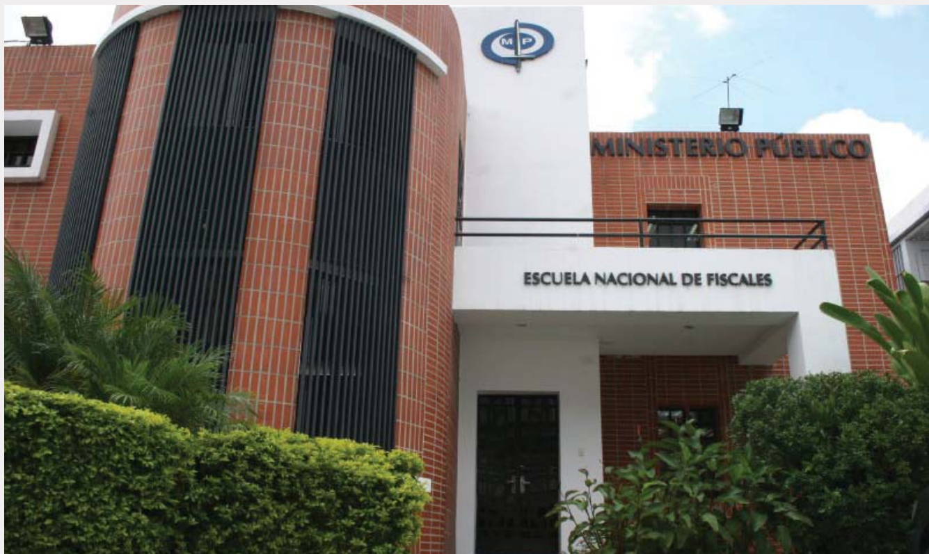
Escuela Nacional de Fiscales del MP ofrece capacitación a otras instituciones como parte del Programa de Formación Continua