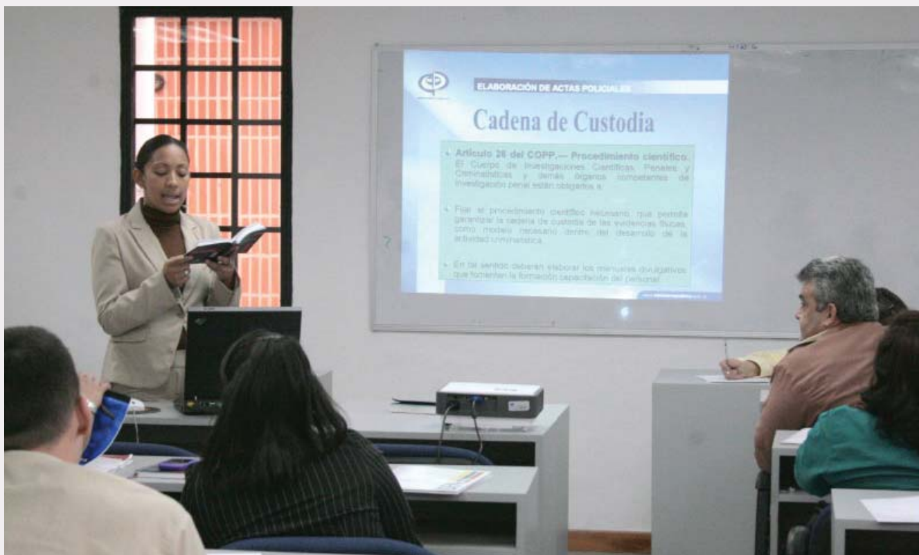
Funcionarios del SENIAT atentos ante ponencia de la fiscal del Ministerio Público

complementar este curso, se tiene previsto que el SENIAT imparta a su vez, a fiscales públicos encargados de las áreas aduanera y tributaria, talleres especializados que ofrezcan aportes a su gestión en la lucha contra el contrabando y los ilícitos tributarios.