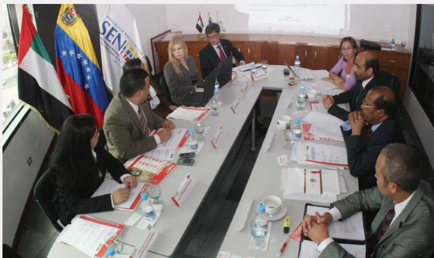
Las delegaciones de Venezuela y Emiratos Árabes Unidos, durante la discusión del convenio