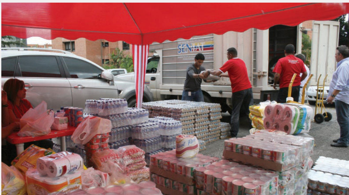
Todo el personal del SENIAT sumó voluntades para apoyar a las personas damnificadas por las lluvias

Una vez más los funcionarios del SENIAT se unen a las políticas humanitarias del Gobierno Bolivariano para brindarle atención a quienes más lo necesitan, esta vez a los compatriotas que resultaron afectados por las recientes lluvias que cayeron en gran parte del territorio nacional