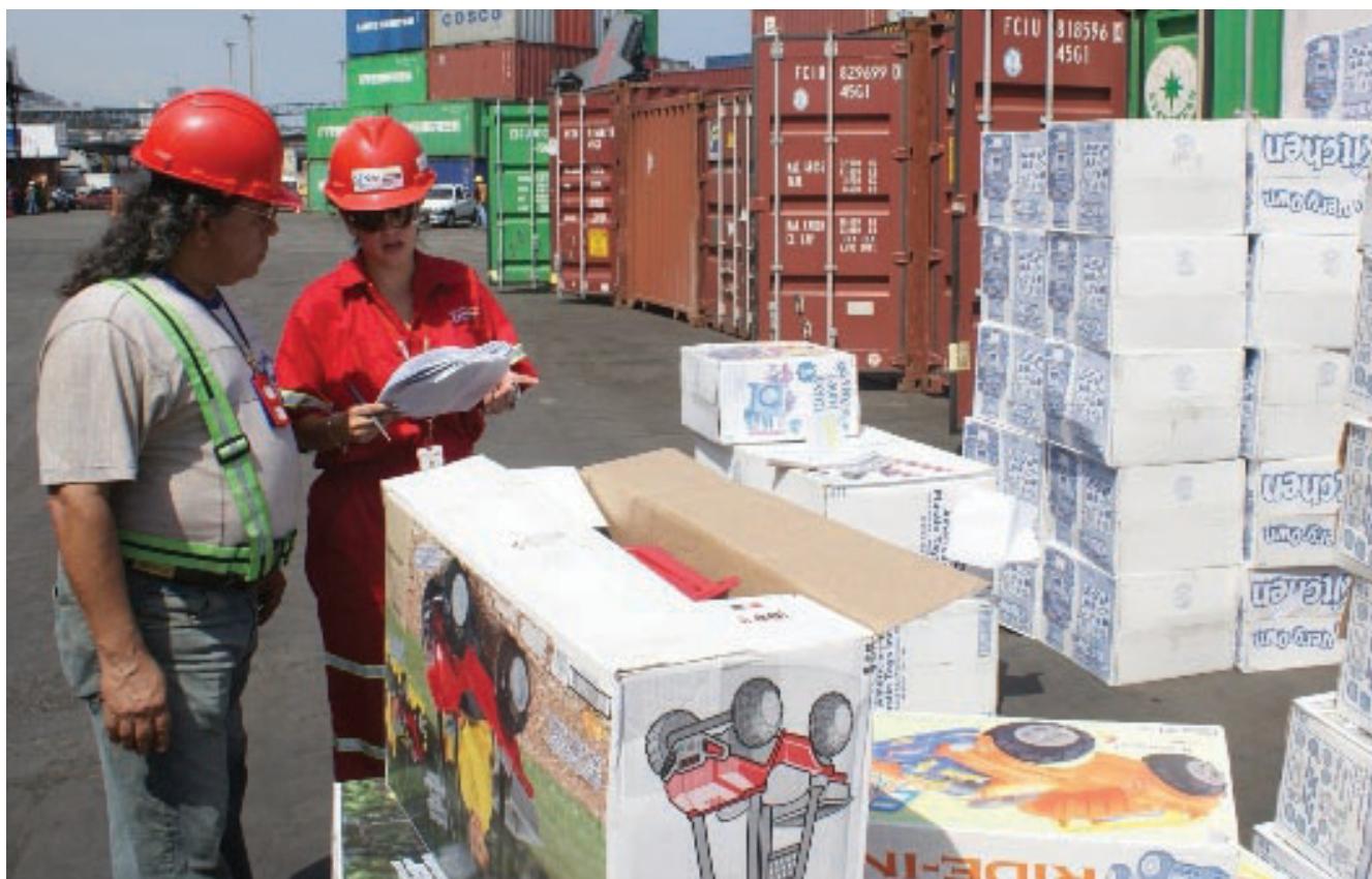
Los funcionarios de la División de Operaciones cumplen con la normativa de seguridad portuaria

Recientemente, la Gerencia de la Aduana Principal de La Guaira renovó la dotación de los uniformes de protección a los funcionarios de la División de Operaciones, a fines de elevar la protección de los trabajadores en sus quehaceres diarios y mantener el cumplimiento de las normas que rigen la seguridad portuaria.