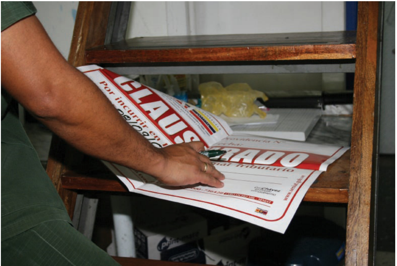
Los contribuyentes que pretendan violar la norma, podrán ser objeto de las sanciones establecidas en el COT

Como parte de los criterios presidenciales de Revisión, Rectificación y Reimpulso promovidos en la Institución, funcionarios de las gerencias regionales de tributos internos comenzaron la ejecución del Proyecto de Línea Blanca en todo el territorio nacional