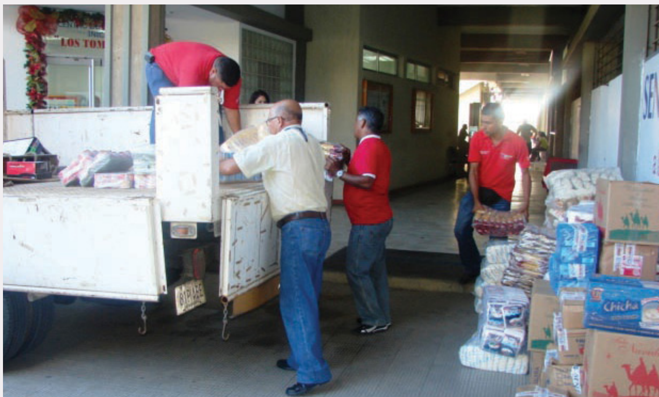
Toneladas de insumos fueron recibidos en los centros de acopio dispuestos en todas las sedes del organismo

Esta acción social permitió entregar toneladas de alimentos no perecederos, centenares de colchonetas, miles de litros de agua potable, grandes cantidades de pañales, artículos de aseo personal, ropa, calzado, medicamentos y otros enseres necesarios para contribuir con nuestro pueblo.