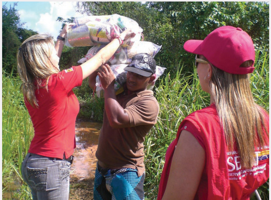
Servidores públicos avocados a atender la situación de emergencia en la Nación

En medio de esta contingencia, los funcionarios de la Región Zuliana aportaron su granito de arena para recolectar la mayor cantidad de insumos y así brindar una ayuda humanitaria a los hermanos de la Guajira, específicamente a los pobladores de los municipios Guajira y Mara, quienes fueron afectados por las fuertes precipitaciones