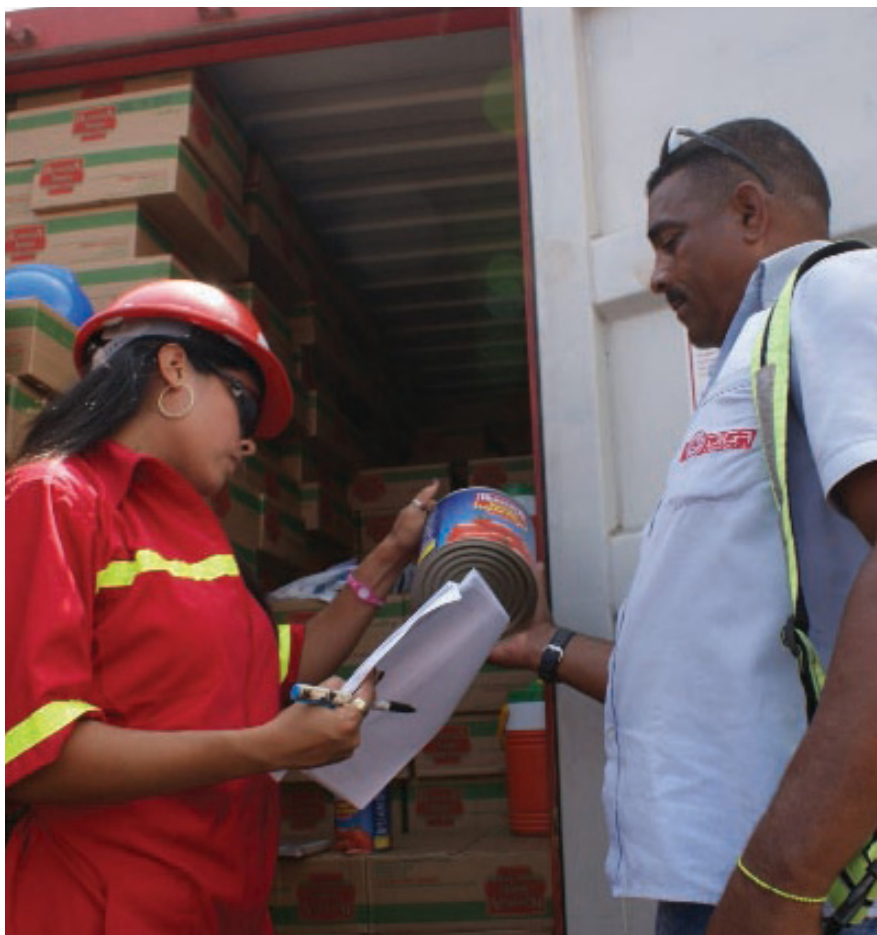
La seguridad es un elemento que está siempre presente en las operaciones aduaneras

En este sentido, los funcionarios de la Aduana Principal de La Guaira deben portar la indumentaria correcta exigida por la Ley Orgánica de Prevención, Condiciones y Medio Ambiente de Trabajo (Lopcyamat). Es por esto que hoy en día, los funcionarios asignados a la labor de reconocimiento de mercancías, portan bragas que facilitan el trabajo y protegen de forma básica ante productos y mercancías que deban ser verificados visualmente, además deben portar cascos, lentes protectores y calzados resistentes elaborados para este uso.