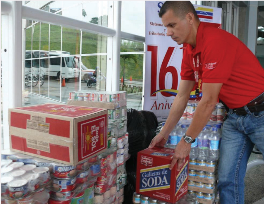
Funcionarios de todas las regiones se sumaron en esta actividad

los cuales serán distribuidos a las personas afectadas por las fuertes lluvias caídas en los últimos días en el estado Nueva Esparta