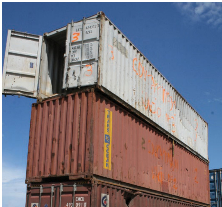
Los materiales una vez clasificados y almacenados, serán despachados a Alemania, donde serán finalmente destruidos

Sin embargo, aclaró Gil que el SENIAT no tendría competencia en el uso y manejo de terreno que ocupa actualmente el Almacén 24, sino la empresa estatal Bolipuertos.