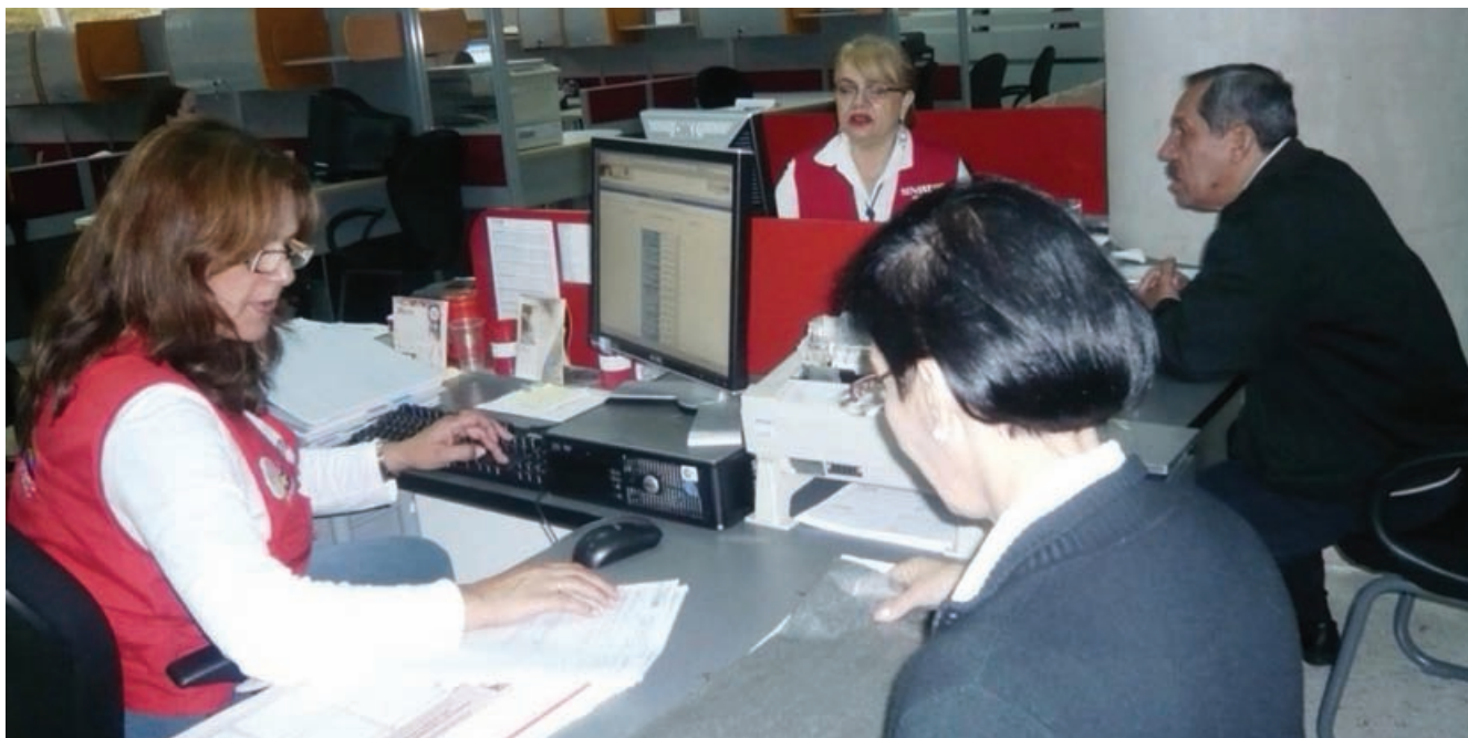
Los funcionarios recuerdan la obligación de declarar y pagar a tiempo

El mensaje sobre este tributo ha sido llevado a todos los rincones de la geografía nacional a través de jornadas de calle mediante las cuales los funcionarios recuerdan la importancia de declarar y pagar a tiempo, exhortando al contribuyente a no dejar la obligación para última hora. La campaña informativa se inicia con un mínimo de dos meses de anticipación en todo el territorio