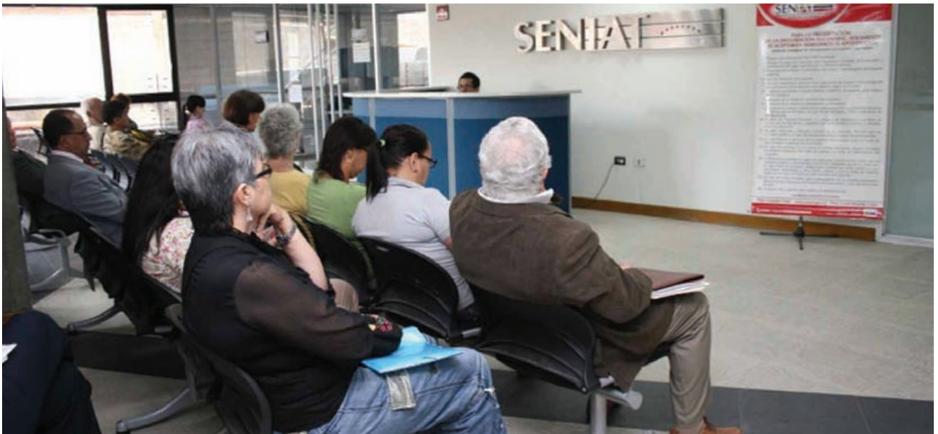
Hasta 300 personas son atendidas en un día por funcionarios de la Coordinación de Sucesiones en Los Ruices

Luego que fallece una persona, los sobrevivientes deben presentar una declaración sucesoral ante el SENIAT en el transcurso de los 180 días hábiles después que ocurre la defunción, lo que determinará la posibilidad de pagar o no el Impuesto Sobre Sucesiones y obtener la solvencia que les permitirá disponer de los bienes heredados