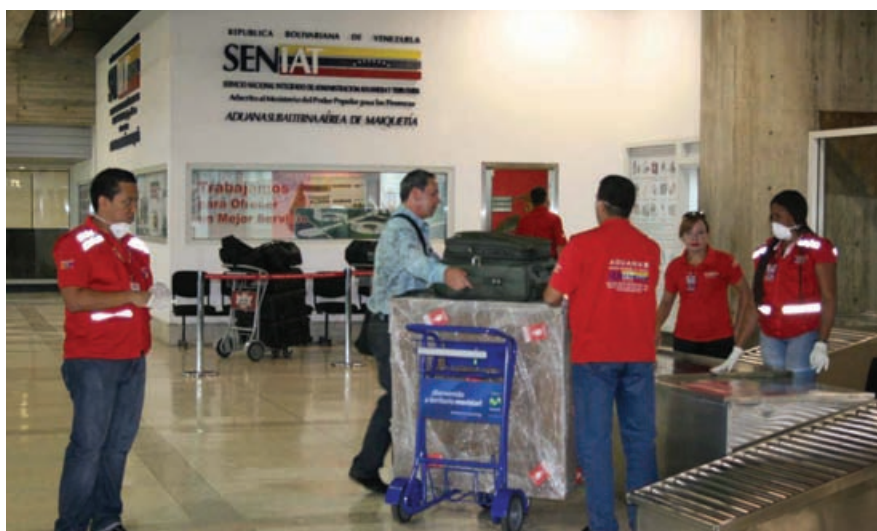
El SENIAT supervisa el equipaje con estas mercancías

El Régimen de Equipaje de Pasajeros está regulado por la Resolución N° 924 del Ministerio de Hacienda, de fecha 29 de agosto de 1991, publicada en la Gaceta Oficial N° 34.790 del 3 de