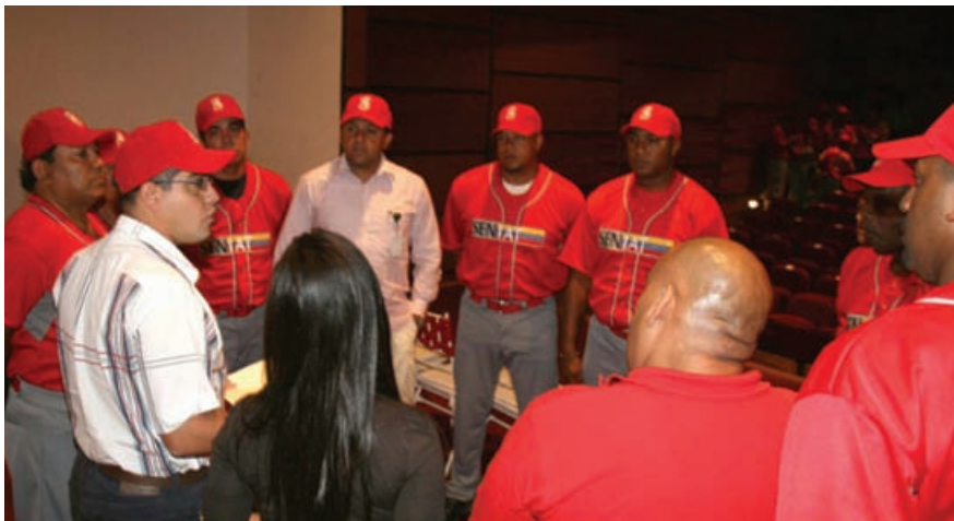
Los niños del SENIAT contarán con un reconocido equipo de profesionales del deporte nacional

De esta manera, el SENIAT lleva a cabo una importante labor para la popularización del deporte en nuestros hijos, en búsqueda de un mayor beneficio socioeconómico para los funcionarios, conforme a los principios de sano esparcimiento social impulsados por el Presidente de la República Bolivariana de Venezuela, Hugo Chávez Frías.