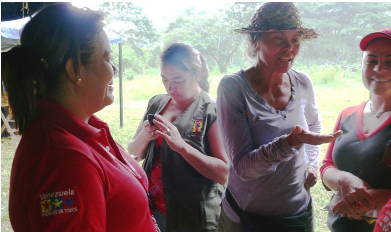
Funcionarios del SENIAT en contacto directo con representantes del pueblo en el Municipio Antonio José de Sucre

De esta forma, el organismo aduanero y tributario ha logrado penetrar a las comunidades organizadas de Barinas, al blindar los vínculos entre la institución y el Poder Popular, llegando a todas las capas sociales, que requieren de información sobre los temas tributarios, que son necesarios en estos tiempos de cambio y transformaciones que vive Venezuela.