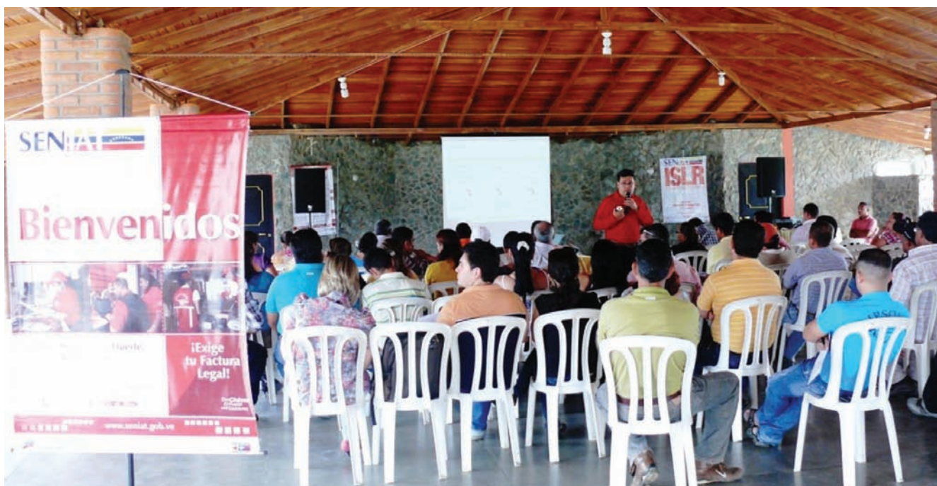
La comunidad organizada se acerca al SENIAT para fundamentar conocimientos sobre Tributos

El trabajo que se viene desarrollando en el municipio Antonio José de Sucre, en Socopó, acelera la formación educativa sobre temas inherentes a los tributos y en otras gestiones propias del organismo recaudador