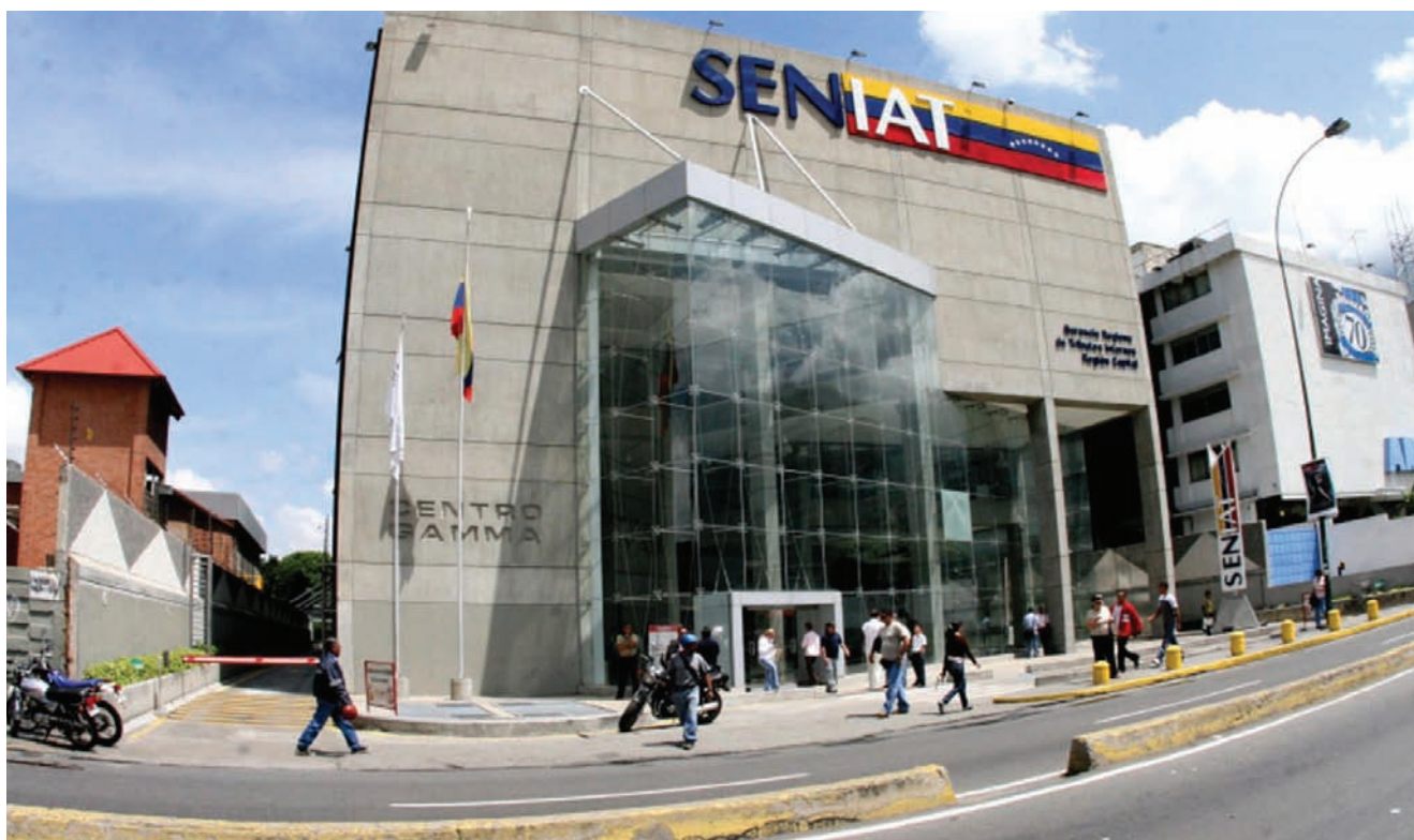
Unos 50 profesionales están al frente del trabajo sucesoral en la sede del SENIAT en Los Ruices.

La declaración sucesoral que debe presentar todo sobreviviente ante el SENIAT, es uno de los trámites de mayor demanda, y obligado a completarse en el transcurso de los 180 días hábiles después que ocurre la defunción