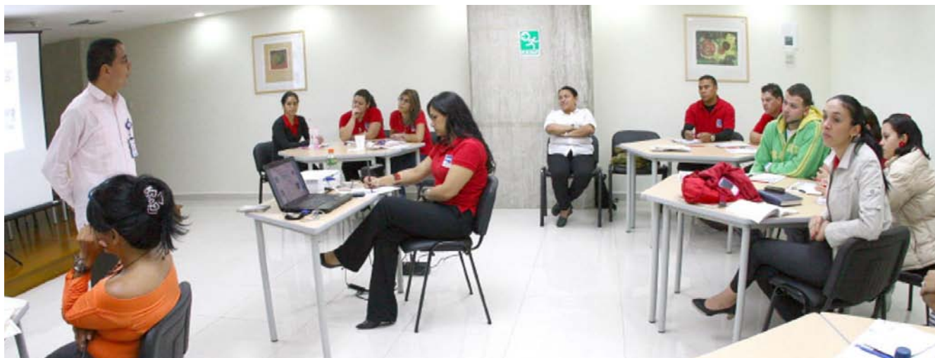
Los funcionarios cuentan con un Diplomado en Componente Docente, que amplía sus competencias profesionales

Con el propósito de contribuir a la formación de cuarto nivel de sus funcionarios, el Centro de Estudios Fiscales del SENIAT ha suscrito convenios con la Universidad Central de Venezuela, la UPEL y la Escuela Nacional de Administración y Hacienda Pública y se procura lograr mayores convenios con otras universidades, que permitan ofrecer los estudios de postgrado en las regiones, así como el Diplomado en Formación Docente, para alimentar estos talentos y que los funcionarios tengan acceso a esta oferta académica.