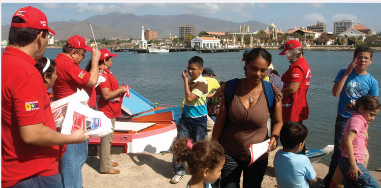
Atención personalizada en puntos de control de la entidad