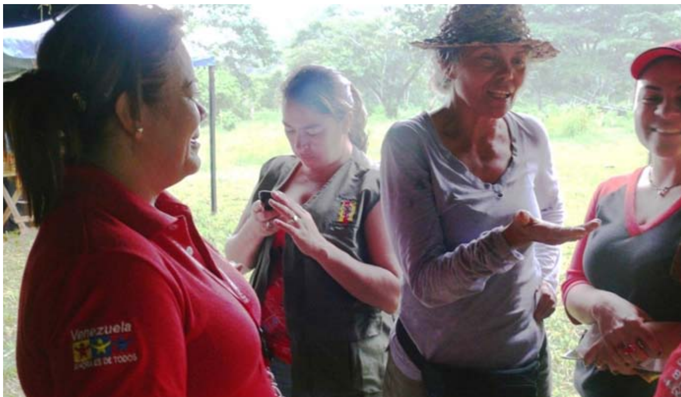
A través del puesto habilitado, el SENIAT ejerce su acción social con las comunidades

El puesto habilitado en la actualidad opera dependiendo de la Aduana Subalterna de Pampatar, tiene bajo su responsabilidad el control del "equipaje acompañado" que contempla la Ley de Puerto Libre del estado Nueva Esparta, con todo lo que implican, las restricciones que da lugar a las retenciones de mercancías y a la aplicación del respectivo arancel. Por allí entran y salen los "Capaitos" que cubren la ruta hacia Chacopata, en el estado Sucre. En un día normal el despacho de embarcaciones llega a once y se movilizan 350 pasajeros. Allí aplica el principio social del SENIAT.