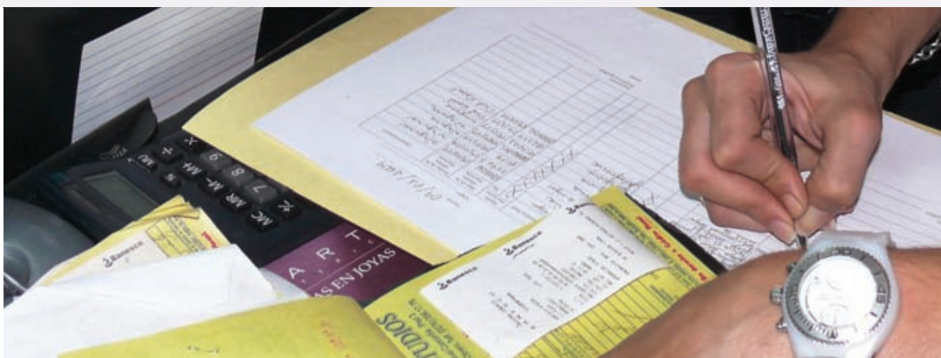
El SENIAT supervisa el cumplimiento de este tributo por parte de los contribuyentes

Este impuesto se aplicó por primera vez el 1º de octubre de 1993, constituye un tributo indirecto que se genera entre el vendedor y el comprador, que grava la enajenación de bienes muebles, la prestación de servicios y la importación de bienes en todo el territorio nacional