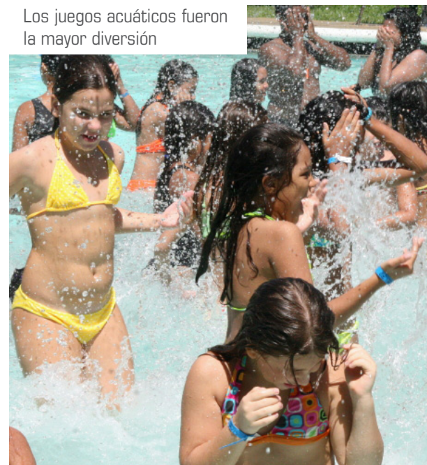
Los juegos acuáticos fueron la mayor diversión