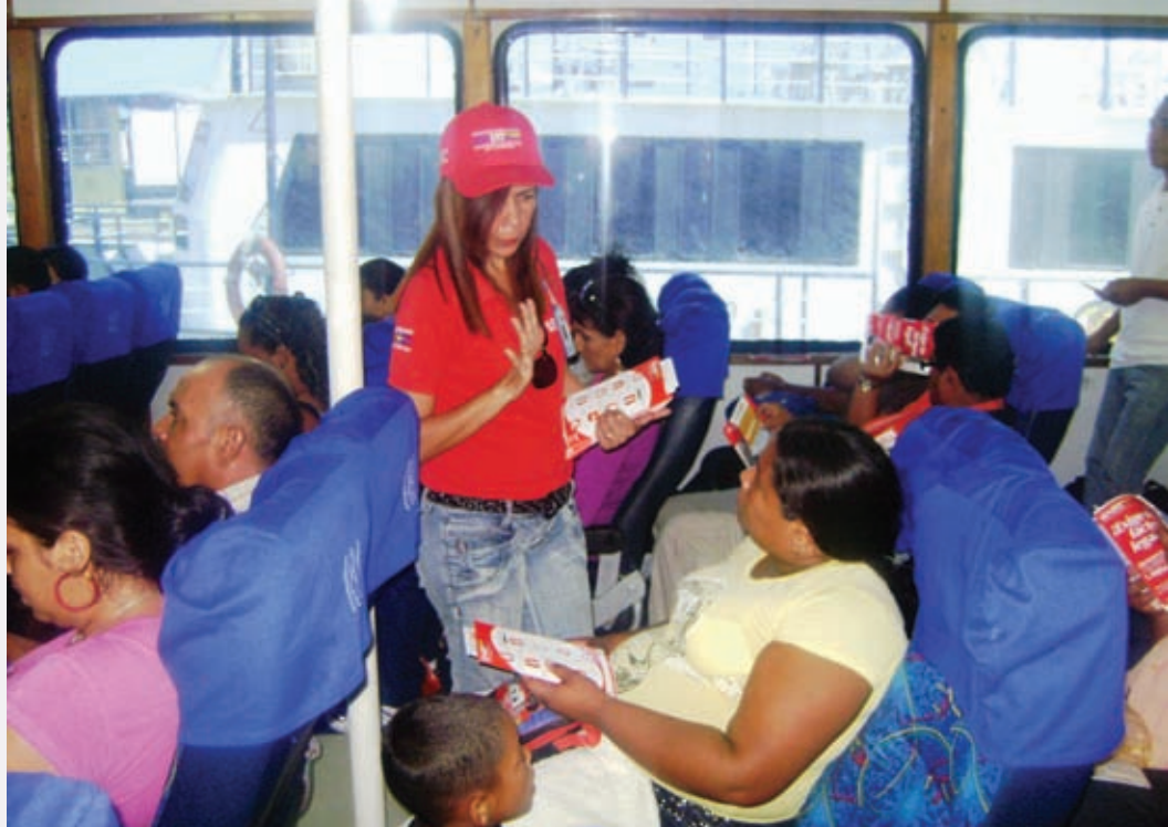
Orientación a pasajeros en puntos de control de la entidad

la ciudadanía y así evitar ilícitos aduaneros y tributarios”.