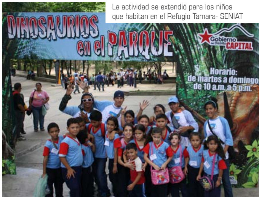
La actividad se extendió para los niños que habitan en el Refugio Tamara- SENIAT

Con estas acciones, el SENIAT garantiza el sano esparcimiento para los hijos de sus funcionarios, quienes con actividades recreativas, deportivas y culturales disfrutaron de unos días llenos de compañerismo y solidaridad, en Reimpulso de la amistad e integración entre los niños y niñas que se levantan como el futuro de una Venezuela Socialista.