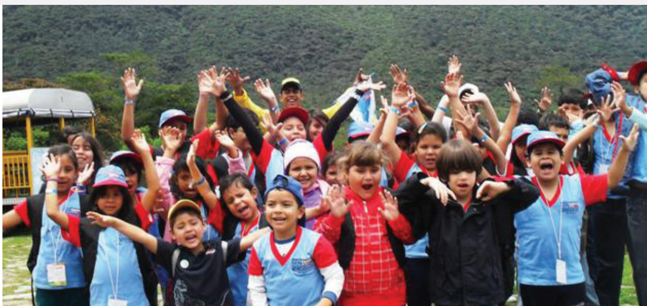
Niñas y niños de todos los estados disfrutaron del Plan Vacacional SENIAT 2011

Con la intención de que la época de vacaciones sea un grato momento de expansión y diversión, el SENIAT organiza cada año las mejores actividades, con la garantía de que los pequeños disfruten de bellos paisajes y recuerdos inolvidables