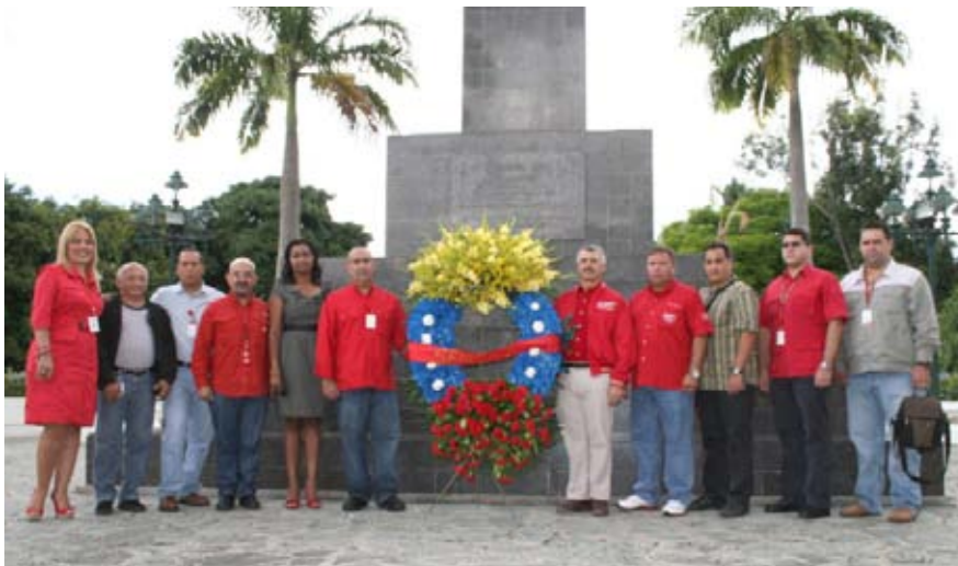
Autoridades del Organismo brindaron una ofrenda floral

charla, organizada por la Oficina de Centro de Estudios Fiscales (CEF) sobre la "Ley Contra la Corrupción" para todos los funcionarios de la Gran Caracas, en la que se ilustró a los presentes en torno a los delitos y las sanciones contemplados en dicha ley, con apoyo en ejemplos puntuales para ilustrar los articulados del mencionado texto legal.