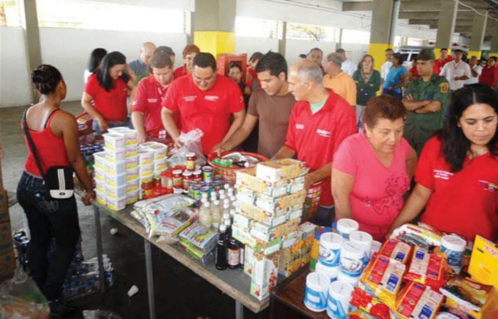
Jornadas de Mercal y Pdval se realizan quincenalmente en la sede