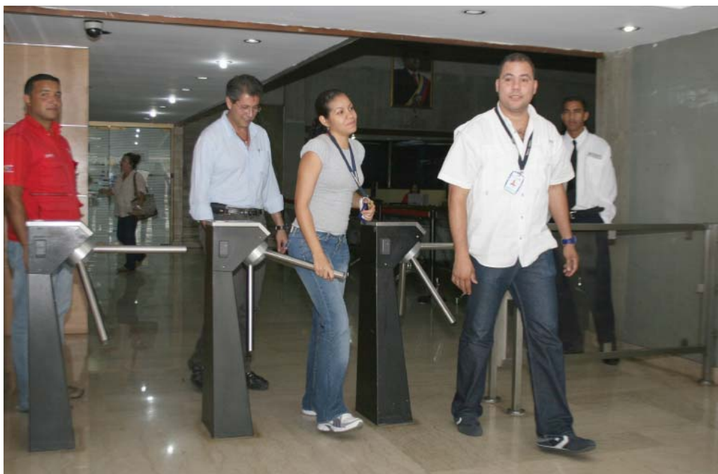
El uso de la tarjeta magnética para el acceso de funcionarios y visitantes se ha implementado en la mayoría de las sedes del SENIAT

U n hecho casi cotidiano es que los oficiales de seguridad hayan tenido la necesidad de hacer llamados de atención en la entrada del lugar de trabajo de las distintas sedes del organismo, por no portar el carnet que lo identifique como funcionario. Este hecho, que podría parecer insignificante, es tan importante como portar la cédula de identidad.