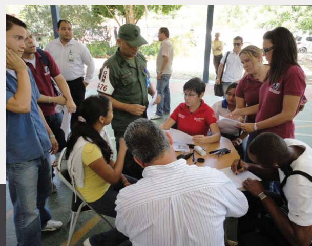
El SENIAT atiende el llamado