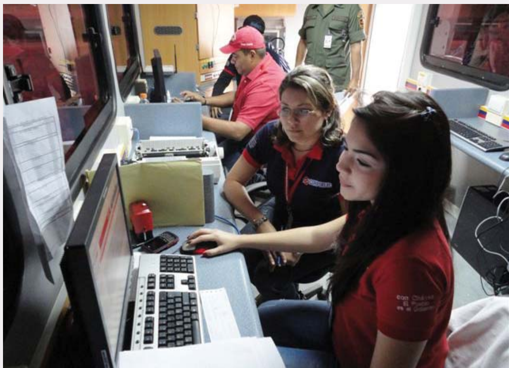
La Unidad Móvil asiste a entes públicos y empresas privadas

Esta cifra se ha alcanzado gracias a la constante disposición de los funcionarios a prestar el mejor servicio a los contribuyentes en la sede de tributos internos y a la visita del SENIAT a las comunidades de los 11 municipios del estado Nueva Esparta, en