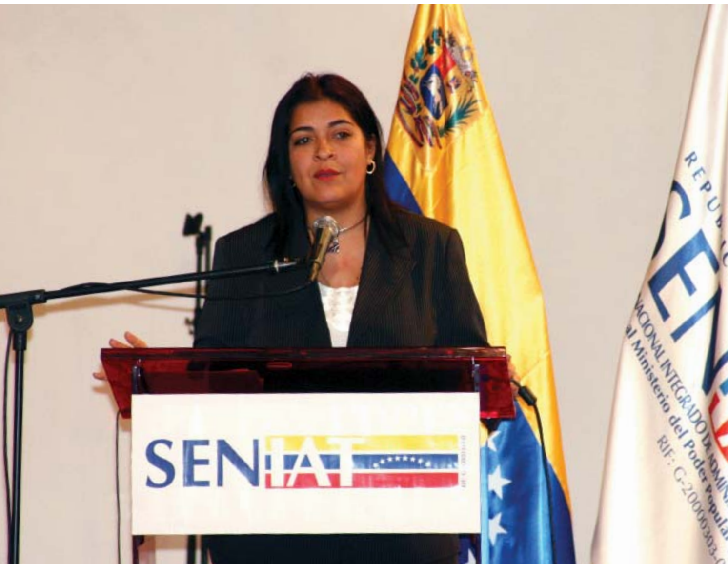
El SENIAT ejecuta encuentros institucionales con diversos actores del sector privado para orientar sobre la providencia 0071