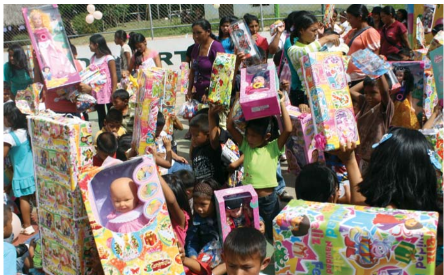
Un total de 5 mil 500 niños y niñas de distintas regiones del país recibieron juguetes por parte del SENIAT

Con este tipo de beneficios, el SENIAT demuestra su compromiso con el pueblo, en sintonía con la construcción de una sociedad más humana con orientaciones socialistas de justicia y distribución equitativa de riqueza para el pueblo que promueve el Presidente Hugo Chávez Frías.