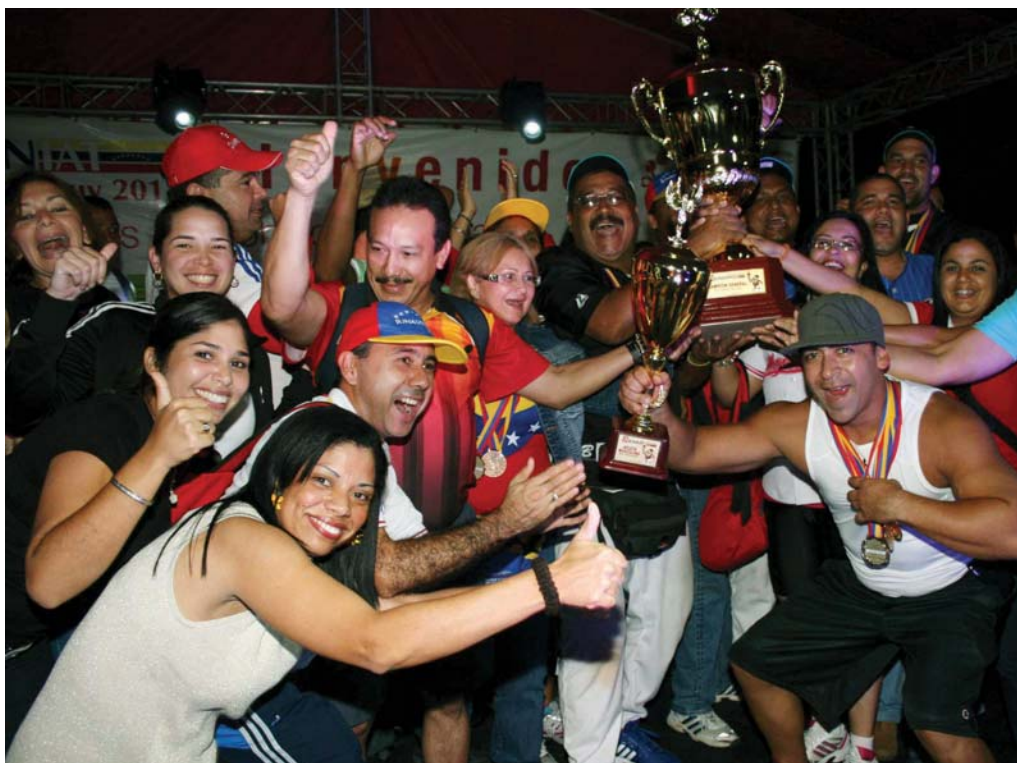
Más de 700 funcionarios fueron los protagonistas de la XII Juegos Nacionales del SENIAT

La Coordinación Nacional de Deportes y sus organizadores, configuraron la participación de este torneo deportivo